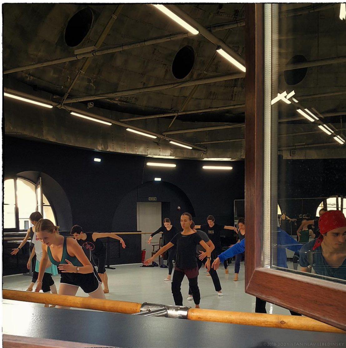
Рисунок 3 – Комплекс построек в настоящий момент

В здании был образован сложный комплекс с множеством помещений, которые целиком и полностью покрывали все потребности труппы. Так, в здании находились помещения для репетиций, артистические комнаты, гримерные, склады, массажные кабинеты и ряд других комнат [11].