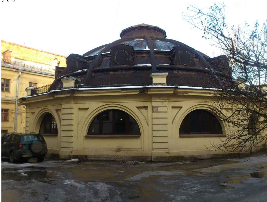
Рисунок 2 – Главное управление государственного коннозаводства. Выводной манеж (во дворе)

Еще одно особенное здание, расположенное на рассматриваемом участке – выводной манеж, его возведение приходится на конец XIX – начало XX в. Точных и полностью подтверждённых данных о его архитекторе не сохранилось, но в большинстве своем историки склоняются к личности П.Ю. Сюзора. Выводной манеж расположен в самом центре участка и имеет своего рода соединения с аукционной конюшней, представляет собой одноэтажное здание, сформированное по типу павильона. Стены данной постройке выложены из кирпича и окрашены в неяркий желтый цвет, а ключевым элементом всего здания является сферический купол с рельефными ребрами и люкарнами между ними (рис. 2) [3].