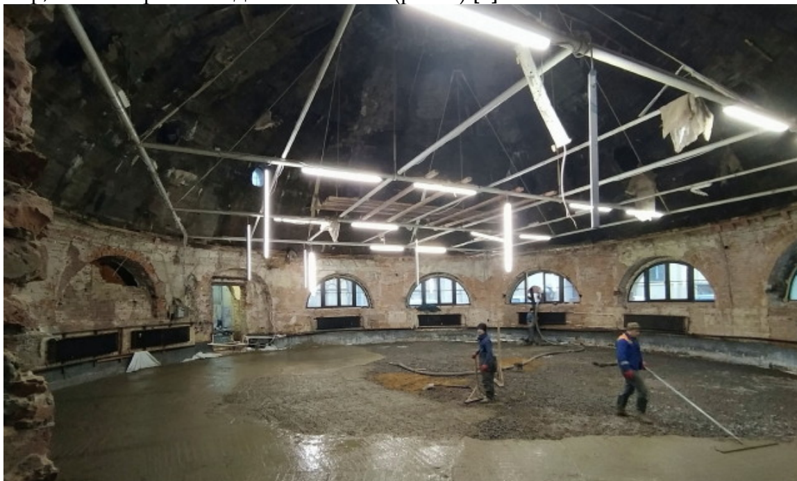
Рисунок 4 – Ремонт здания Манежа в 2021 г.

На данный момент в рассматриваемом комплексе находится Санкт-Петербургский государственный академический театр балета им. Леонида Якобсона, после 2000-х гг. здание не перестраивалось, капитального ремонта также не проводилось, отмечается лишь ряд косметических работ, которые были направлены на исправление мелких проблем, но исторический облик комплекса в серьезной степени они уже не меняли. В конце 2021 года, например, начался ремонт здания Манежа (рис. 4) [2].