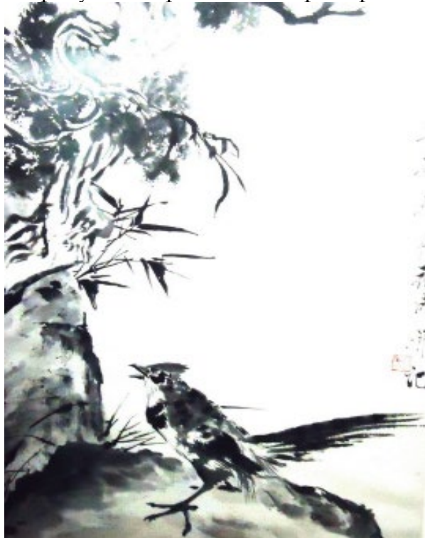
Рисунок 2 - Гонконгский стиль в графическом дизайне [12]

На рисунке 2 представлен пример гонконгского стиля в графическом дизайне.