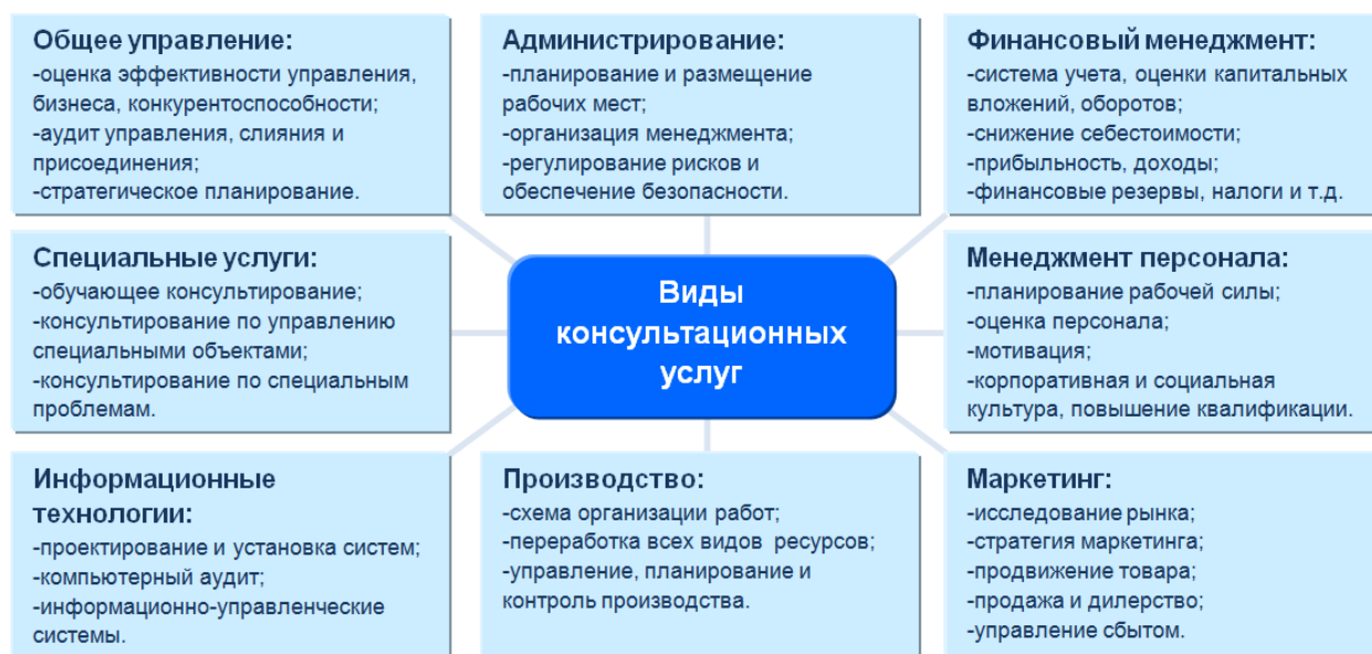
Рисунок 1 – Классификация рынка консалтинговых услуг [5,6].

В связи с трансформацией экономики и бизнеса после пандемии консалтинговых услуг произошли изменения: