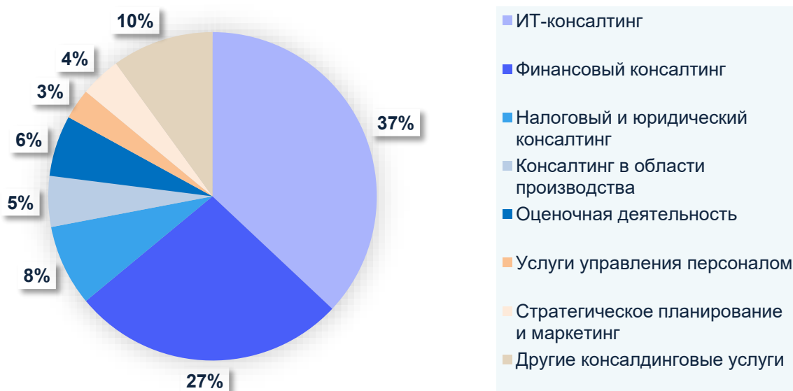
Рисунок 4 – Структура выручки консалтинговых услуг в России на 2021 г., %

в HR-консалтинге участники рейтинга подчеркивают необходимость оценки человеческих ресурсов и автоматизации функций управления персоналом, а в стратегическом консалтинге – разработки проектов цифровой трансформации, планов развития инфраструктуры и макроэкономических исследований.