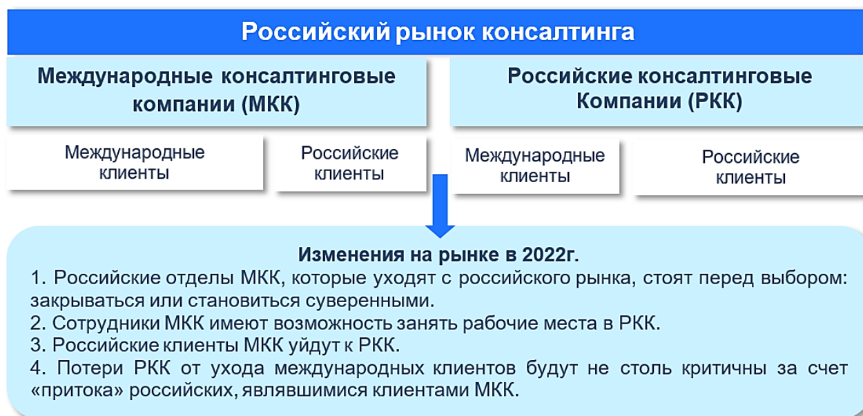
Рисунок 5 - Схема трансформации российского рынка консалтинговых услуг

Для обобщения вышеизложенной информации о трансформации рынка консалтинговых услуг была сформирована соответствующая обобщающая схема (рис. 5.)