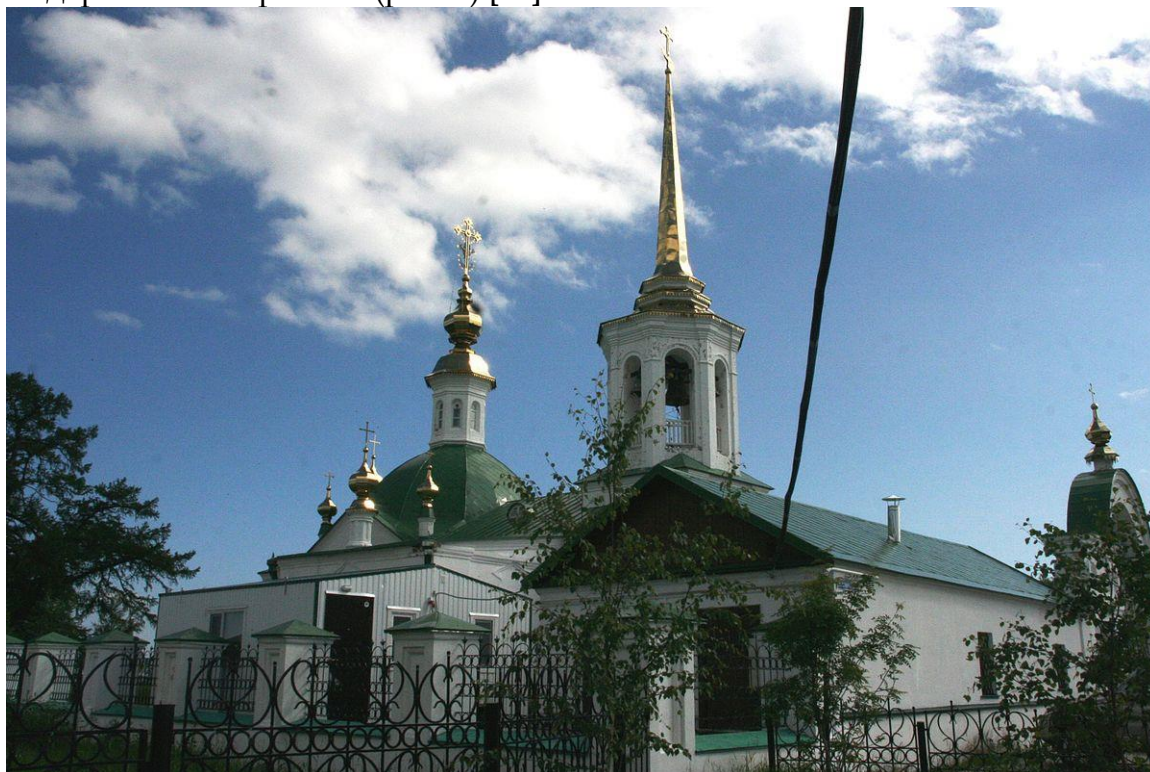
Рисунок 1 – Храм Рождества Пресвятой Богородицы в настоящее время

Г. Березов (ныне пос. Березово) несмотря на малую площадь, обладает целым рядом впечатляющих зданий и сооружений, обладающих культурной и исторической ценностью. Один из наиболее впечатляющих из них – Храм Рождества Пресвятой Богородицы (рис. 1), который в 1823 г., в отличие от современного варианта, представлял собой достаточно крупное деревянное строение (рис. 2) [11].