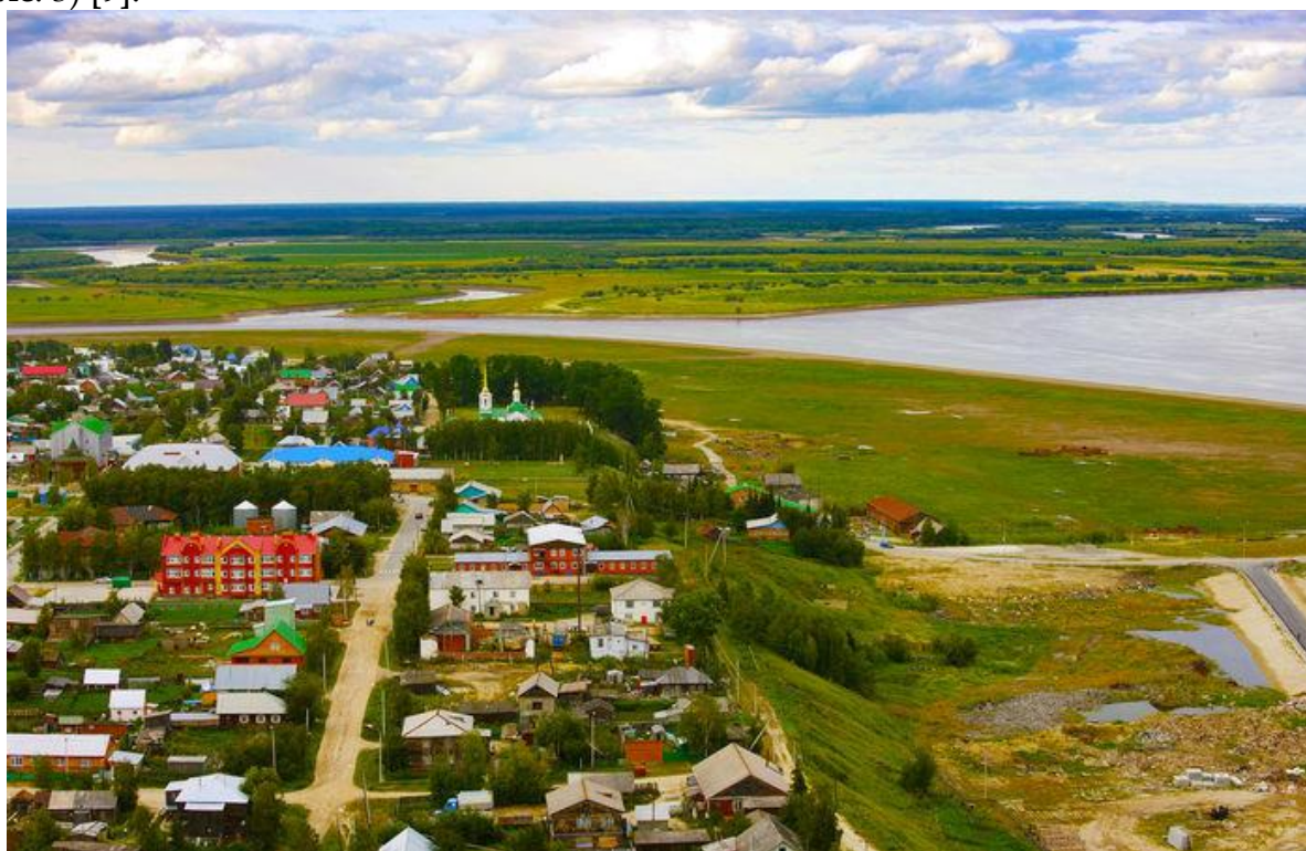
Рисунок 3 – Поселок Березово

Не менее значимая отличительная черта этого поселка, которую невозможно не упомянуть при его анализе – уникальная гармония с окружающей средой: город как бы вписан в уже существующий природный ландшафт, не нарушает, а великолепно дополняет его (рис. 3) [9].