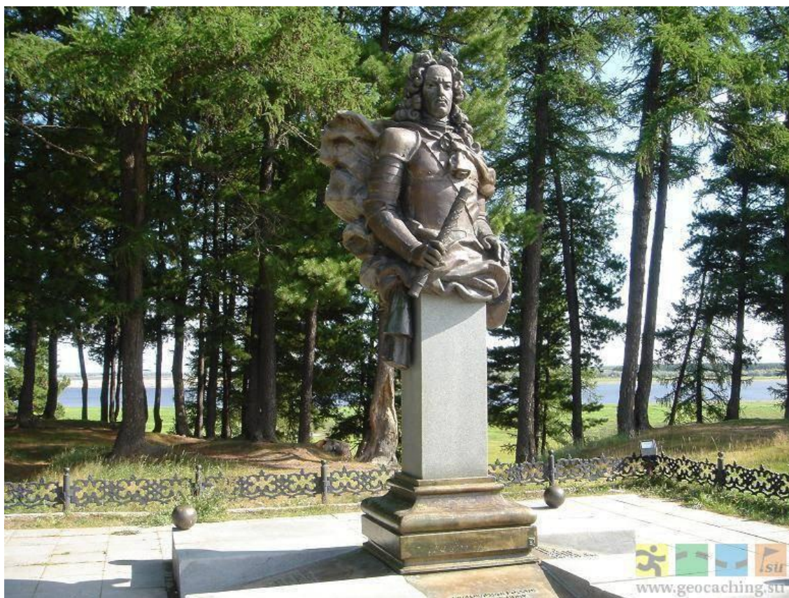
Рисунок 4 – Памятник Александру Даниловичу Меншикову

Таким образом, на примере г. Березова показана необходимость и практическая значимость проведения комплексного и поэтапного анализа и оценки недвижимых объектов историко-культурного наследия. Каждый из пяти вышеописанных этапов позволит собрать максимально комплексную информацию и фактологическую базу об изучаемом объекте и позволит выработать наиболее эффективные рекомендации по их сохранению и конструктивному использованию.