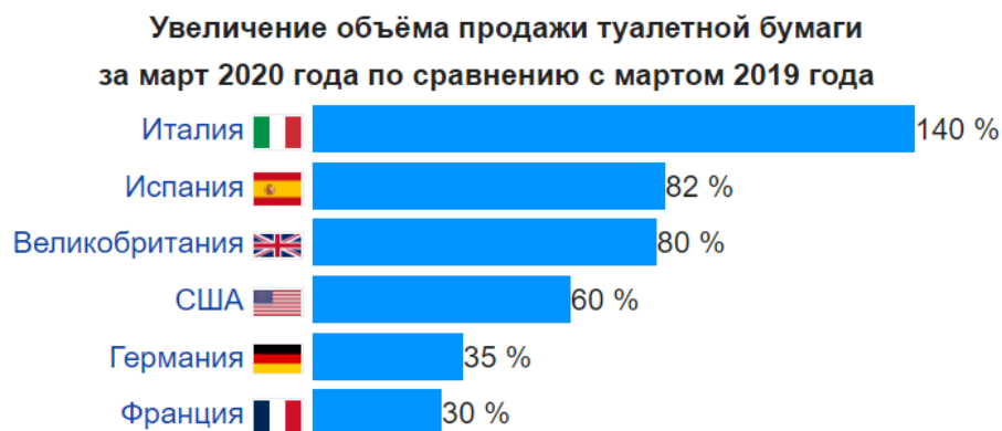
Рисунок 3. Динамика объема продажи туалетной бумаги за март 2020г. по сравнению с мартом 2019г.

товары. Стоит отметить, что неблагоприятная динамика денежных доходов больше относится к доходам тех работников, заработная плата которых гарантируется не бюджетом, а зависит от результатов хозяйственной деятельности [14]. В результате снижения доходов произошло значительное снижение спроса на предметы роскоши, и как следствие, экспорта и импорта данных товаров. Напротив, спрос на товары первой необходимости в странах значительно возрос, что можно увидеть на примере объема продаж туалетной бумаги на рисунке 3.