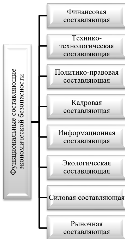
Рисунок 1 – Функциональные составляющие экономической безопасности [3, с. 60]

Экономическая безопасность является понятием комплексным, поэтому необходимо отметить, что оно включает в себя некоторые функциональные составляющие, существенно отличающихся друг от друга по своему содержанию (рис.1).