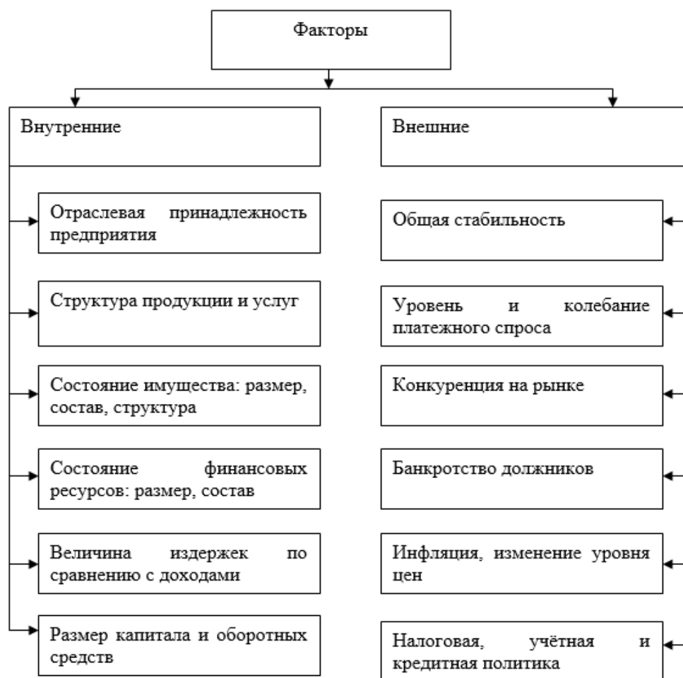
Рисунок 3 – Факторы, оказывающие влияние на финансовую устойчивость [5]

Далее, представляется целесообразным кратко проанализировать финансовую устойчивость российских предприятий.