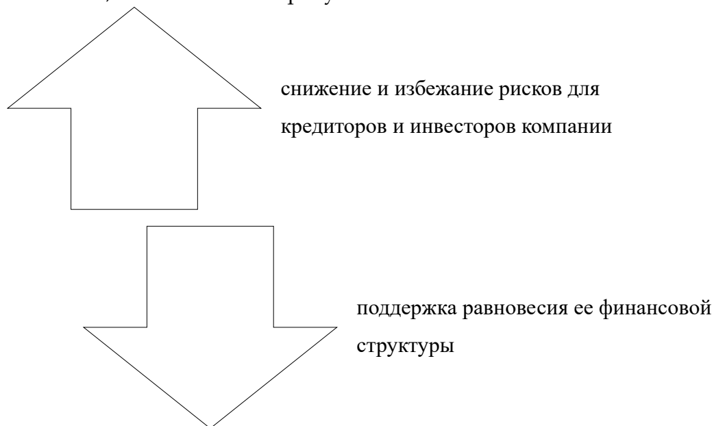
Рисунок 2 – Одновременная направленность финансовой устойчивости [5]

Рассматривая экономическую устойчивость, важно отметить ее одновременную направленность, что показано на рисунке 2.