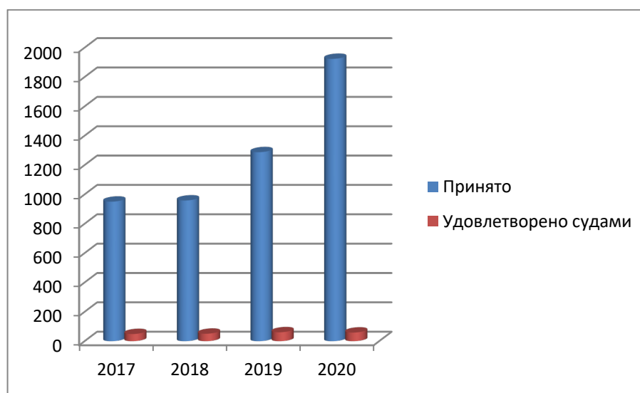
Рисунок 1. Общее количество исковых заявлений об оспаривании незаконных действий (бездействия) должностных лиц УФССП России по Приморскому краю, принятых судами к рассмотрению, за период 2017-2020 гг.

По итогам работы ФССП России за период 2016-2020 гг., в общем, отмечается динамика по сокращению количества удовлетворенных судами Российской Федерации административных исковых заявлений об оспаривании постановлений, действий (бездействия) должностных лиц ФССП России [4]. Аналогичная тенденция наблюдается и при подаче жалоб на незаконные действия должностных лиц ФССП России в порядке подчиненности [2] (рис. 1).