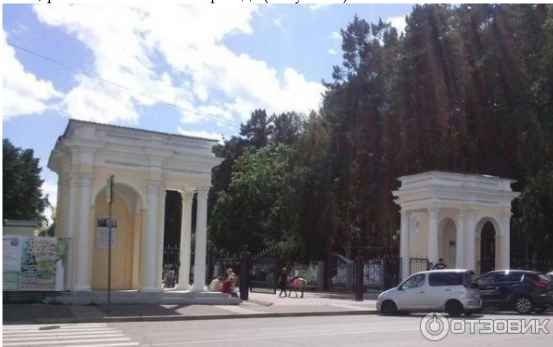
Рисунок 3 – Центральный вход в парк г. Железногорска

Особенно красиво был украшен центральный вход в парк: посетителей встречали шикарные входные павильоны (архитектор И.Б. Орлов), которые были украшены величественными колоннами. У подножия павильонов располагались клумбы, а перспективу партера плавно закрывали два деревянных павильона с колонными портиками, расположенными на фасаде (Рисунок 3).