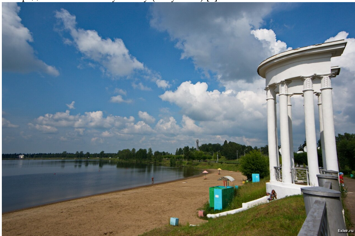
Рисунок 4 – Ротонда в железногорском парке

Уже ближе к концу десятилетия парк начал развиваться в западном направлении: там был организован городской пляж и водный спортивный комплекс, который организовывался уже в стиле, более близкому к советскому неоклассицизму, и был наполнен такими элементами, как буфет, гардероб, а также павильон, специально организованный для работающего там персонала. Прекрасным дополнением и настоящим украшением данного водного комплекса стала монументальная ротонда, которая плавно вела непосредственно к самому пляжу (Рисунок 4) [5].