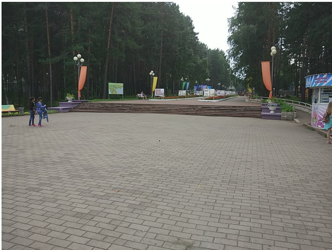
Рисунок 1 – Центральная аллея в г. Железногорске

В 1951 году был разработан самый первый план парка культуры и отдыха в Железногорске, и главными авторами и архитекторами данного проекта стали И.А. Путешова и М.А. Белый. Одним из наиболее оригинальных и визуально красивых решений стал живописный рисунок так называемой ограничительной береговой линии, в соответствии с изгибами которых и располагались ключевые дорожки, аллеи и павильоны. Центральная аллея являлась естественным продолжением главной городской улицы, от нее отходили второстепенные аллеи и мелкие прогулочные дорожки свободного типа (Рисунок 1) [2].