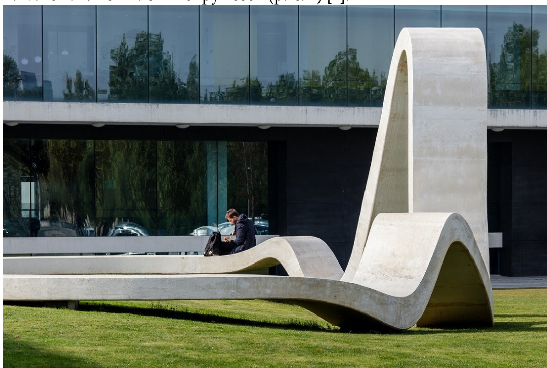
Рисунок 2 – Озелененное пространство в г. Порту

Особенно развита сеть общественных пространств в г. Порту – втором по величине городе в Португалии и одном из самых знаменитых университетских городов мира. Яркий пример: озелененное пространство с «Петлей», которое привлекает к себе студентов, прохожих и оживляет жизнь вокруг себя (рис. 2) [1].