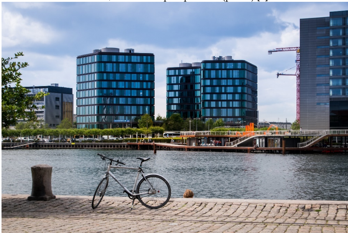
Рисунок 1 – Публичный бассейн в г. Копенгаген

Одно из самых ярких общественных пространств подобного типа - публичный прибрежный бассейн в самом центре Копенгагена, в районе Islands Brygge. Ранее неприметная промышленная территория была превращена в общедоступное и экологически безопасное общественное пространство (рис. 1) [3].