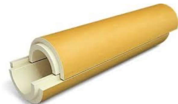
Рисунок 1. Скорлупа из пенополиуретана с покрытием стеклопластик [4]

Скорлупа из полиуретана с покрытием стеклопластик (рис.1) – это один из видов теплоизоляции ППУ применяется для изоляции труб диаметром от 25 мм до 1220 мм крепится на поверхность стальной трубы при помощи крепежных элементов. Это современный готовый теплоизоляционный материал, который состоит из двух половин с замками [4; 5]. Скорлупу допускается монтировать на трубопроводы в любое время года, даже при отрицательных температурах.