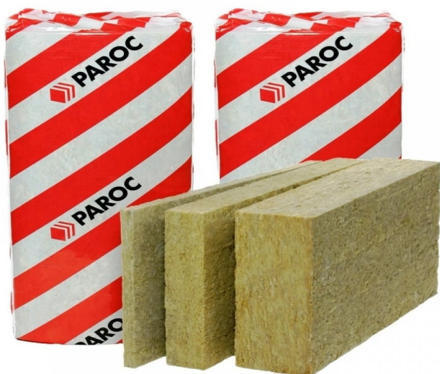
Рисунок 4. Утеплитель PAROC eXtra [8]

Предлагается использовать каменную вату фирмы «Paroc» (рис. 4). Данный материал практичен и доступен для утепления любого здания. Его теплоизоляционные характеристики проверены временем.