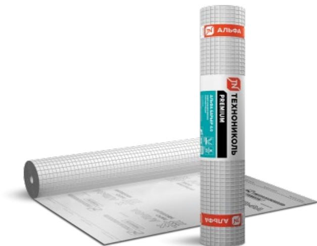
Рисунок 5. Гидроизоляционная пленка «Технониколь» [9]

Рекомендуется использовать трехслойную гидроизоляционную пленку с антиконденсатным ворсом «Технониколь» (рис. 5).