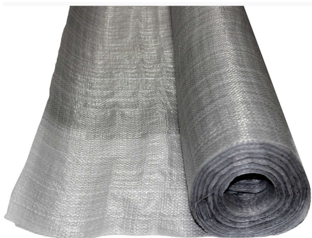
Рисунок 3. Пароизоляционная плёнка “Изоспан” [6]

Для реализации данной меры используем фольгированную четырехслойную пароизоляционную плёнку фирмы «Изоспан» (рис.3), как наиболее эффективную на сегодняшний день.