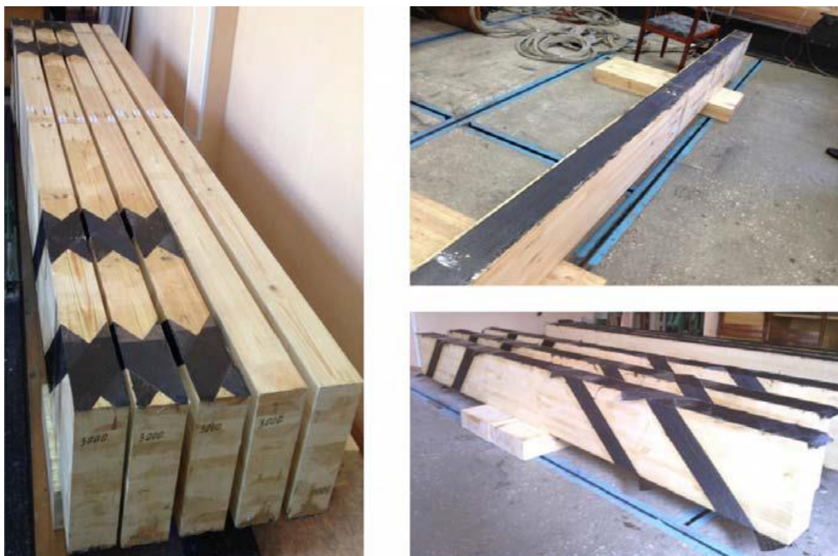
Рисунок 3 – Внешнее армирование несущих деревянных конструкций композитной лентой

[Режим доступа: https://top-technologies.ru/ru/article/view?id=32288 ]