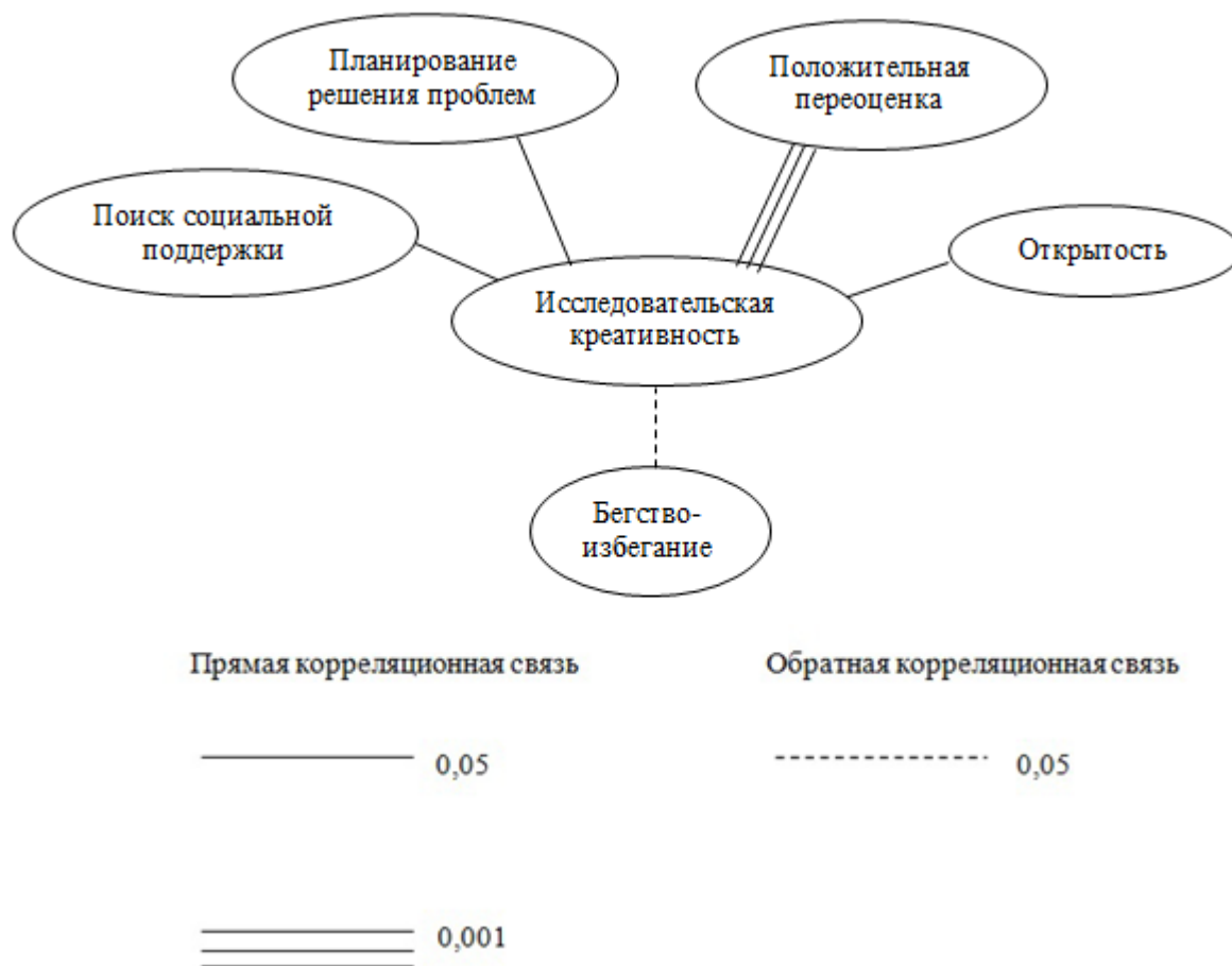
Рис. 2. Результаты корреляционного анализа показателей копинг-стратегий и самооценки наркозависимых со шкалой «Исследовательская креативность».

Полученные результаты позволяют сделать предположение о том, что чем выше уровень исследовательской креативности (которая предполагает умение искать, анализировать и синтезировать информацию из множества источников, способность как давать, так и учитывать конструктивную обратную связь, умение посмотреть на проблему с разных точек зрения и рассматривать мнение, противоположное своему, как имеющее место быть) у респондентов, тем больше они: