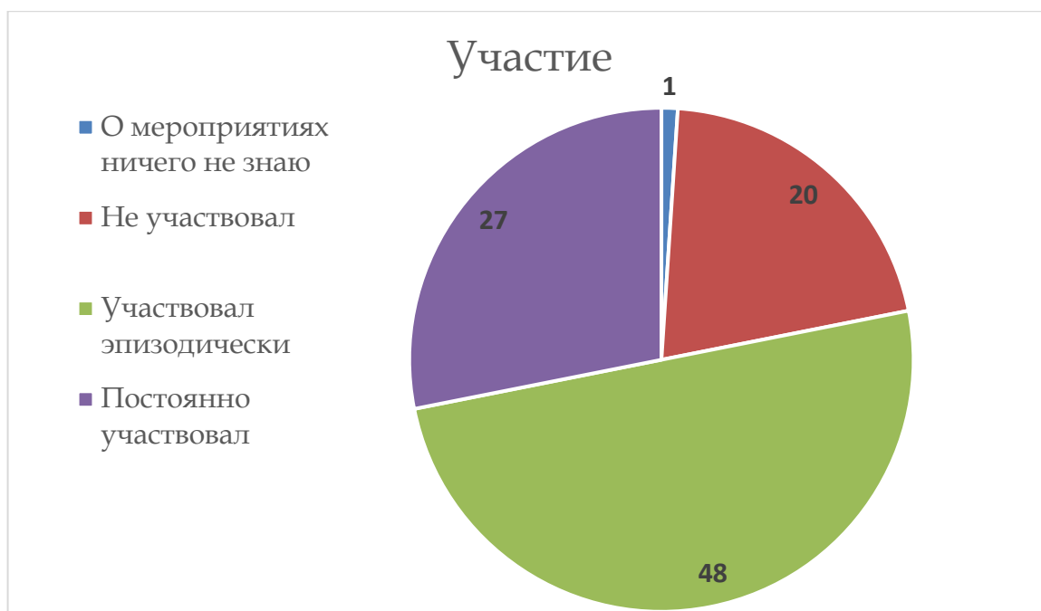
Диаграмма 1. Вовлеченность учащихся в мероприятия на уровне школы.

Несмотря на то что в гимназии, согласно документам (плану воспитательной работы, публичному докладу, программе воспитания), коллективным делам отведена особая роль – они рассматриваются как основа стержень всего воспитательного процесса, только треть гимназистов принимает участие в организации и проведении коллективных творческих дел на постоянной основе. Данные по вопросу «Участие обучающихся в подготовке и проведении мероприятий на уровне школы» можно увидеть на Диаграмме 1.