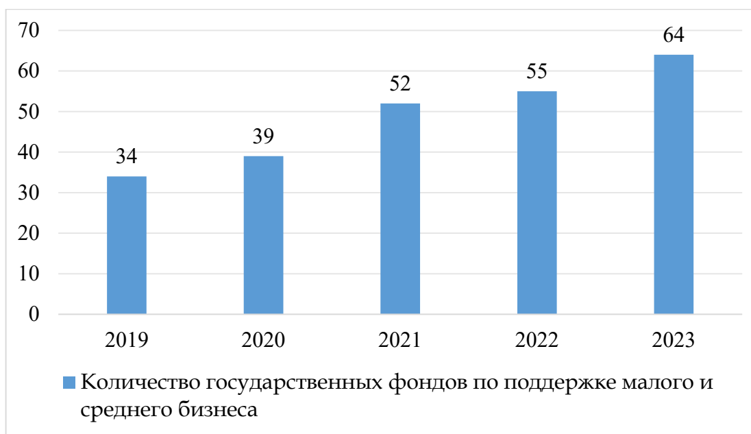
Рисунок 4. Данные о количестве государственных фондов по поддержке малого и среднего бизнеса в КНР [2]

Китайские программы развития страны предусматривают довольно внушительный экономический рост и увеличение эффективности деятельности народного хозяйства именно за счет комплексного развития, в том числе малого и среднего бизнеса. В частности, утверждены программы, рассчитанные на полную модернизацию китайской экономики вплоть до 2020-2050 годов. Одной из таких программ является принятая в 2003 году программа социально-экономического развития страны до 2020 года, предусматривающая к 2050 году полную модернизацию всей отраслей экономики.