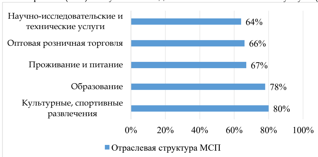
Рисунок 3. Отраслевая структура малых и средних предприятий в Китае [2]

В 2023 году малые и средние предприятия составляли 58% третичной сектора Китая. Как показано на рисунке 3, топ-пять ведущих отраслей в секторе МСП: культурные, спортивные и развлечения (80%), образование (78%), проживание и питание (67%), оптовая розничная торговля (66%) и научно-исследовательские и технические услуги (64%).