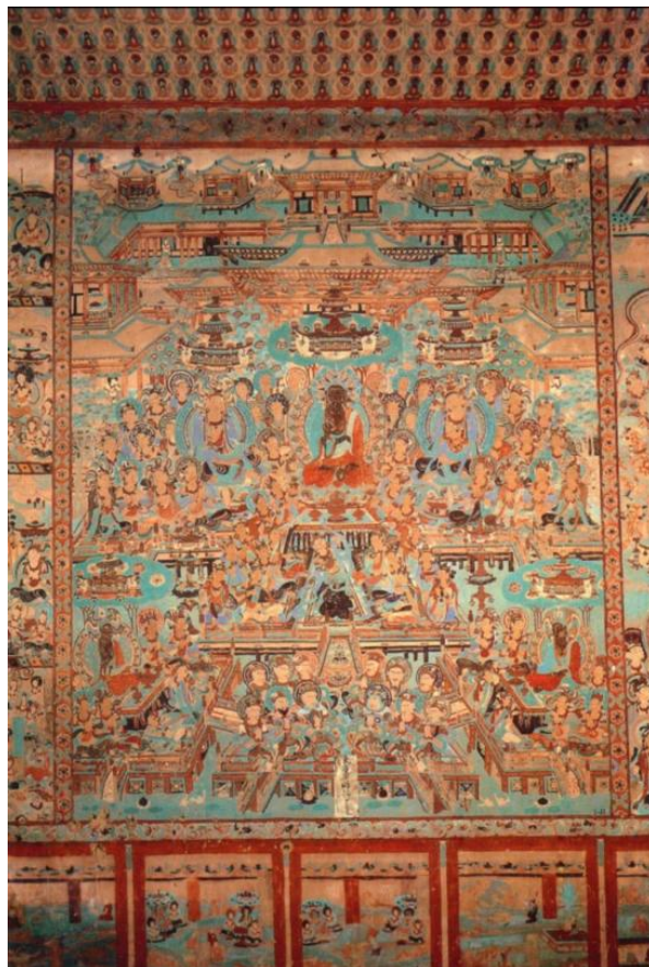
Рис 3 пещера № 12 Последний период династии Тан.[10]

«Лотосовая сутра» + «Амитабха-сутра» + «Майтрейя», северной стене пещеры: «Аватамсака-сутра» + «Сутра Будды Медицины»; южной стене № 18: «Амитабха-сутра» + «Сутра Майтрейи», северной стене: «Сутра Будды Медицины»; южной стене пещеры № 107: «Сутра Будды Медицины» + «Сутра Небесного приглашения», северной стене: «Амитабха-сутра» + «Майтрейя»; южной стене пещеры № 128: «Сутра Будды Медицины», северной стене: «Амитабха-сутра» + «Сутра Майтрейи»; северной стене пещеры № 147: «Амитабха-сутра» + «Сутра Майтрейи», южной стене: «Амитабха-сутра» + «Сутра Майтрейи», северной стене: «Сутра Будды Медицины»; южной стене пещеры № 192: «Амитабха-сутра» + «Сутра Майтрейи», северной стене «Сутра Будды Медицины».