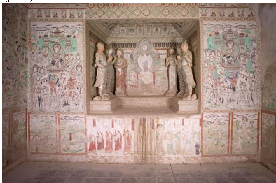
Рис. 2 пещера № 159

Типичными для среднего периода династии Тан являются росписи на южной стене пещеры № 159 (рис.2):