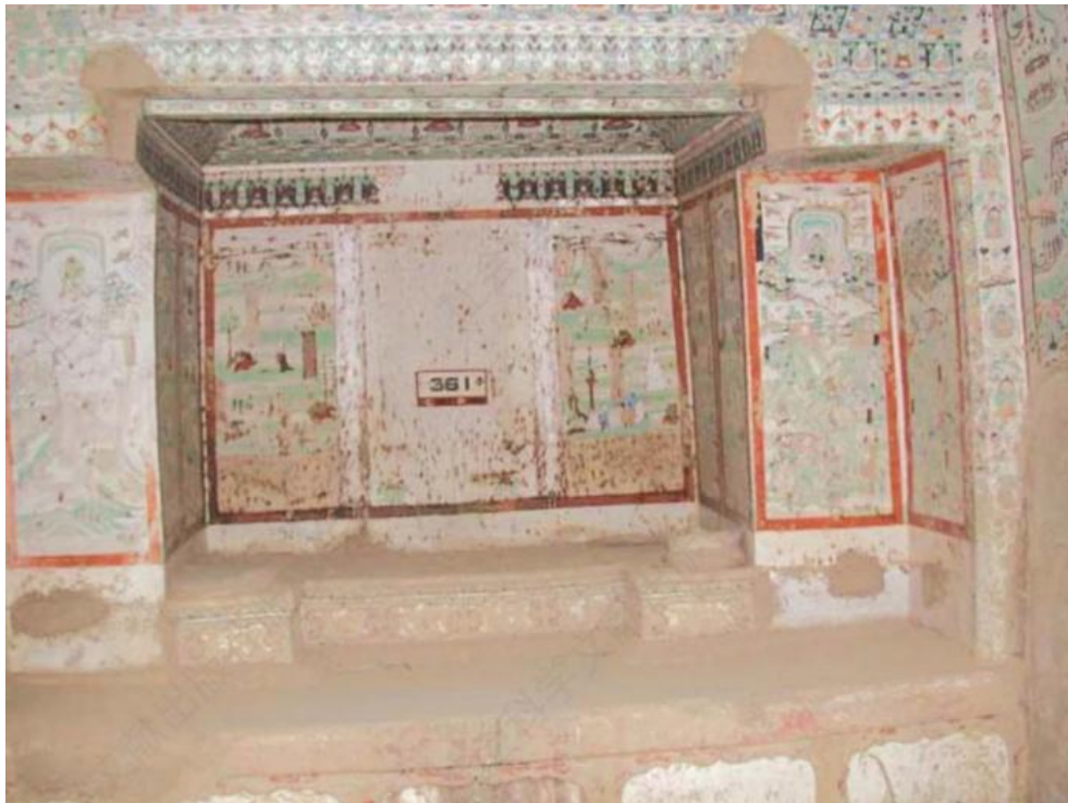
Рис 4 пещере № 361 среднего периода династии Тан.[11]

В пещере № 361 (Рис 4) среднего периода династии Тан также имеется иллюстрация к «Сутре Будды Медицины». Будда Медицины изображен держащим в руке чашку, также на картине присутствуют изображения хоругвей и двенадцати святых. Стоит отметить, что