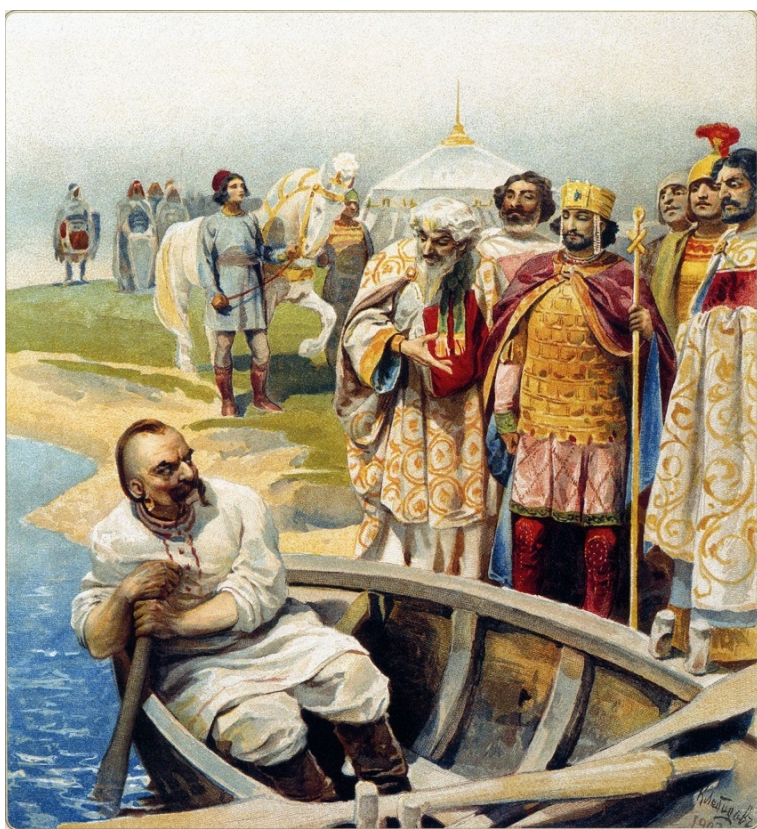
Рисунок 10– Встреча Святослава с византийским императором Цимисхием на берегу Дуная, описанная Львом Диаконом. Художник К. В. Лебедев, 1880 г.

Для того, чтобы брить бороду и голову, необходимо иметь при себе зеркало и остро наточенную бритву. Далеко не каждый мужчина в VIII – IX вв. в Европе мог себе позволить такую роскошь. А русы могли.