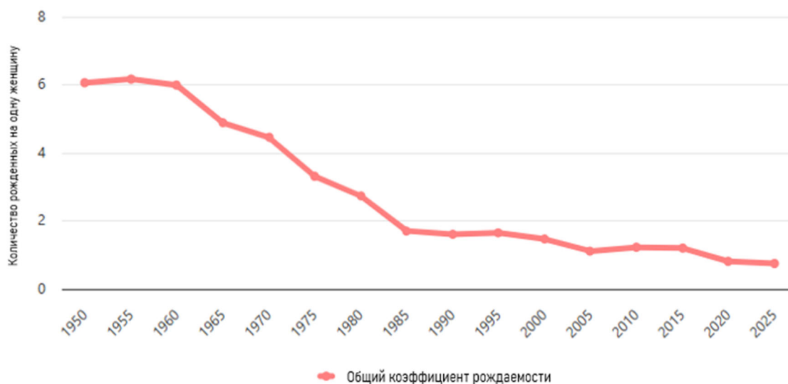
Рисунок 2. Общий коэффициент рождаемости в Южной Корее

В 2024 году уровень рождаемости в Южной Корее составил всего 1,2 ребенка на женщину, что является вторым из самых низких показателей в мире, еще ниже уровень только в Гонконге, там он составляет 0,94. Для сравнения, средний уровень рождаемости, который необходим для воспроизводства населения, составляет примерно 2,1 ребенка на женщину [8]. Снижение уровня рождаемости можно увидеть на рисунке 2.