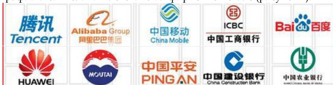
Рисунок 4 – Китайские бренды [3]

Во многих современных китайских брендах используются элементы традиционной каллиграфии и символики в логотипах и фирменном стиле (рисунок 4).