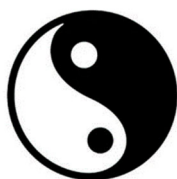
Рисунок 2 - Баланс инь и ян [1]

Инь и ян являются фундаментальной философской категорией, отражающей взаимодействие противоположностей и их взаимодополнение (рисунок 2).