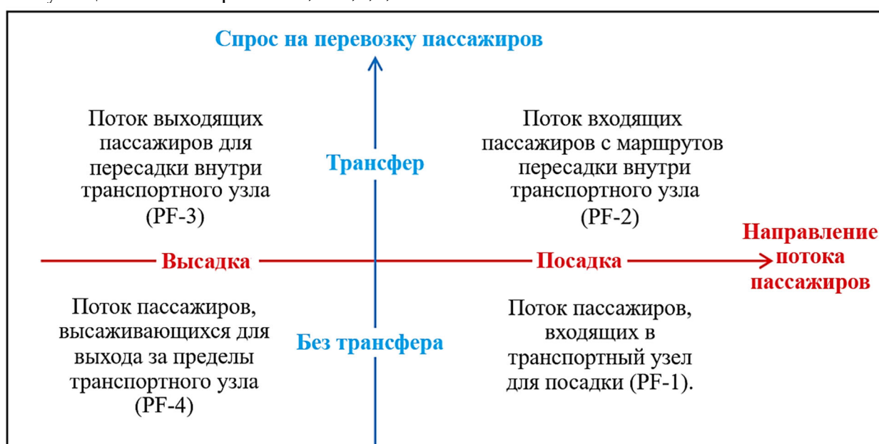
Рис. 1 Классификация пассажиропотока на платформе городского транспортного узла (составлено автором)

На платформе городского транспортного узла пассажиропоток можно разделить на поток пассажиров, сающихся в транспортное средство, и поток пассажиров, выходящих из транспортного средства; кроме того, его также можно разделить на поток пассажиров, совершающих пересадку, и поток пассажиров, не совершающих пересадку. Классификация пассажиропотока показана на рисунке 1. PF- i – упрощенный символ, обозначающий соответствующий пассажиропоток, i=1,2,3,4 .