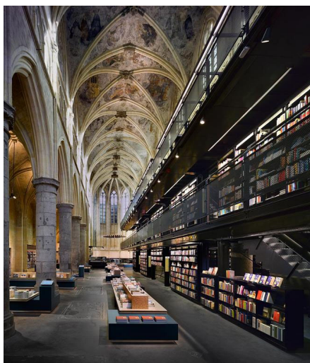
Рисунок 4. Книжный магазин Dominicanen

Книжный магазин Dominicanen расположен в готической церкви 13 века в Маастрихте. После Французской революции церковь была секуляризирована и многократно меняла функции: склад, школа, выставочный и концертный залы, архив, почта и даже велостоянка. Сейчас здание используется как книжный магазин с кафе и баром (рис. 4). Новая конструкция из стали не соприкасается со стенами, позволяя посетителям изучать готическую архитектуру храма. В новый объем интегрированы книжные стеллажи, антресоли с обзорными площадками. Здесь регулярно проводятся лекции и музыкальные выступления, а также предусмотрено пространство для временных и постоянных выставок.