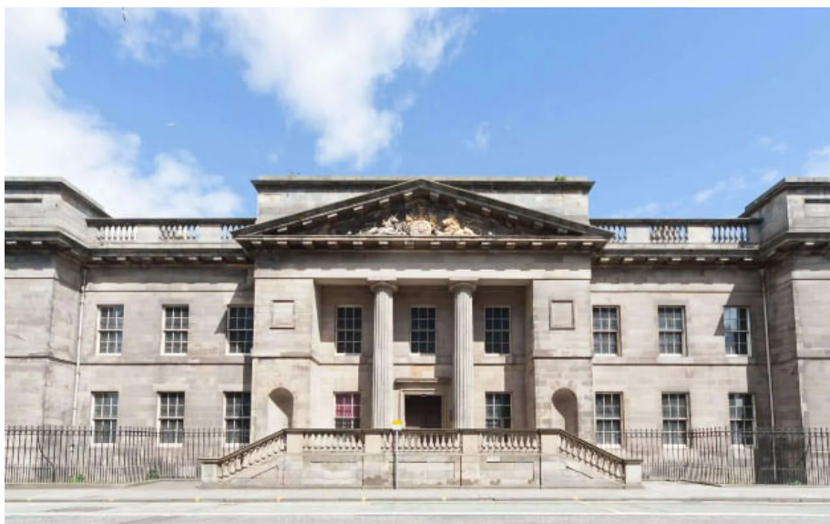
Рисунок 1. - Здание Таможни в Лейте