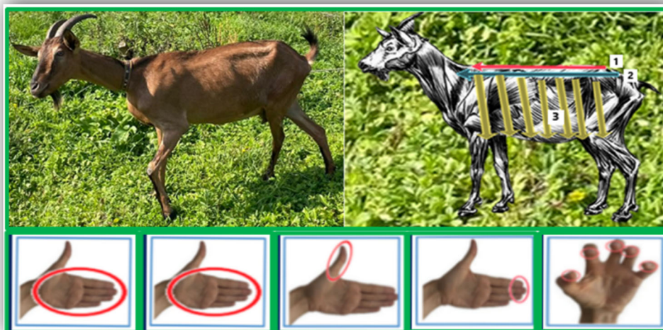
Рис.1. Ветеринарный мануально классический массаж (ВМ МКМ) по условным линиям (1-3), Capra hircus (коз) зааненско-нубийской (З-Н) и альпийской (А) пород.

С.н.:S-N;А пребывали в чистом помещении, в соответствии с гигиеническими нормами, с круглосуточным проветриванием (при открытом окне), вольер ежедневно чистился, доступ к поильнику с чистой водой и соли с добавками осуществлялся свободно, вычесывание шерсти щеткой производилось в вечернее время и т.д. Дневной рацион кормления соответствовал возрастной и биологической норме. Состоял из разнообразной свежей травы с концентратами, витаминами, сеном, овощами, веточными кормами. Кормление в течении суток осуществлялось с равным промежутком (3-4 раза), первое кормление не ранее 7-00 часов и последнее - не позднее 19-00 часов.