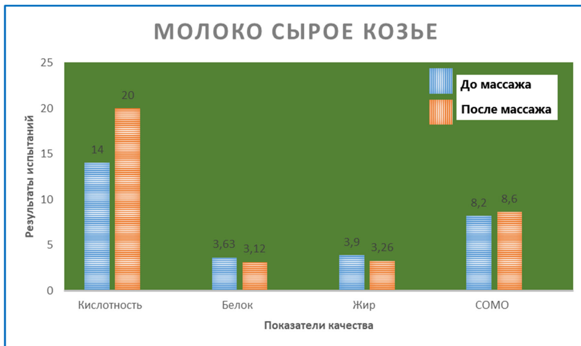
Рис.2. Гистограмма результатов физико-химических показателей сырого молока Capra hircus (коз) альпийской породы, до - и после - ветеринарного массажа (ВМ МКМ).