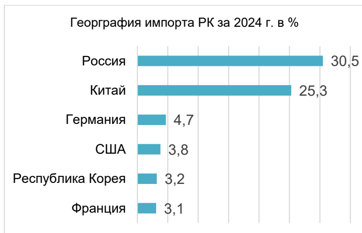
Рисунок 5. География импорта РК за 2024 г. [12]

Рассматривая график стран, которые поставляют продукцию в Казахстан можем сделать ряд ключевых выводов: