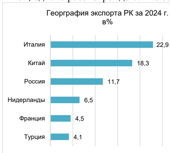
Рисунок 4. География экспорта РК за 2024 г. [15]

География внешней торговли Республики Казахстан может быть на первый взгляд показаться предсказуемой, т.к. страна граничит сразу с двумя странами с самой большой экономикой, однако рассмотрев детально составим графики экспорта и импорта.